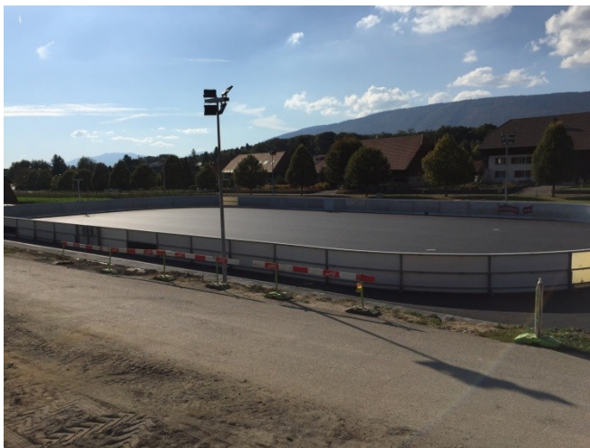
Aktuelle Situation mit neuem Streethockeyfeld